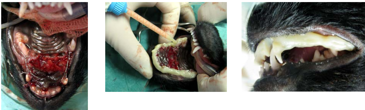
Kuvasarja 2: Oronasaaliyhteys korjattiin kollegeenikalvolla ja murtuma stabiloitiin hampaisiin kiinnitetyllä metallilanka+komposiittikiskotuksella. Huomaa, että kuvissa pentu on operaation aikana selällään.