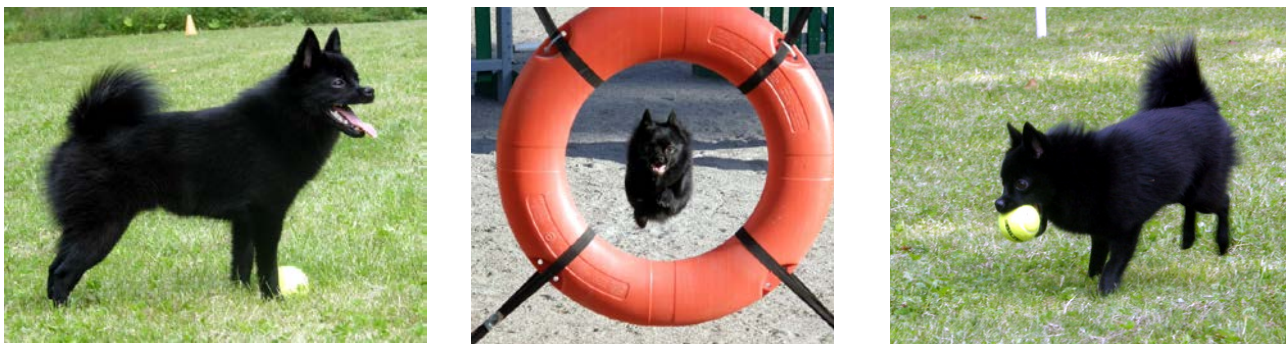
Kuvasarja 5 ( Copy AML ): Toiminnallinen ja iloinen pentu leukamurtumakorjauksen jälkeen.

Kirjoittaja: Helena Kuntsi-Vaattovaara, ELL, DEVDC, DAVDC